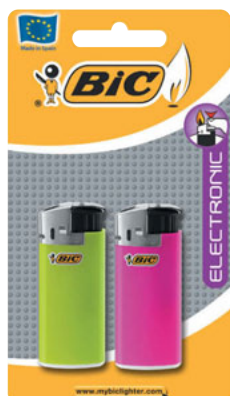
J39 MINITRONIC AST M 2 UNID. CÓD. 862286