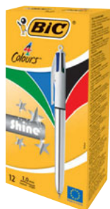
4 COLOURS SHINE CAJA/CAIXA 12 UNID. CÓD. 919380