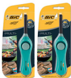
MEGALIGHTER U140 MULTI CÓD. 862261