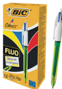
4 COLOURS FLUO CAJA/CAIXA 12 UNID. CÓD. 933948