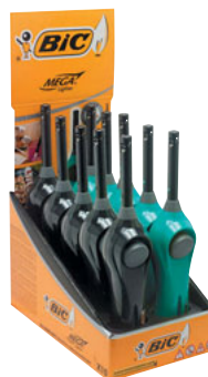
MEGALIGHTER U140 MULTI DISP 10 UNID. (SIN BLISTERS) CÓD. 893899