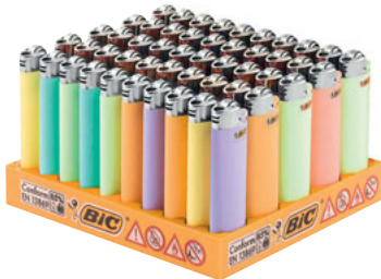
J25 MINI PASTEL 50 UNID. CÓD. 866384