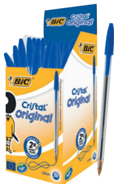
CRISTAL ORIGINAL CAJA/CAIXA 50 UNID. CÓD. 8373609