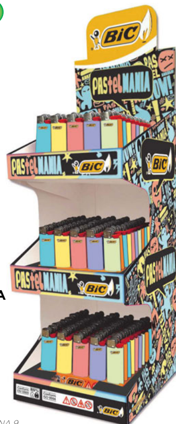
J25 PASTELMANIA DSP 150 UNID CÓD. 946252