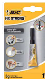
PEGAMENTO/COLA FIX STRONG CAJA/CAIXA 24 UNID. CÓD. 901758