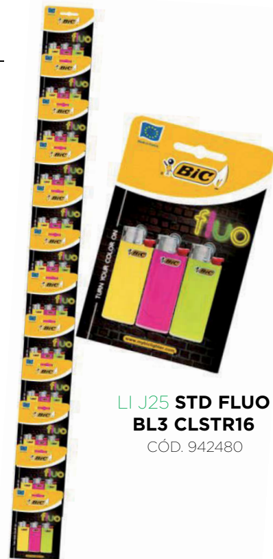
LI J25 STD FLUO BL3 CLSTR16 CÓD. 942480