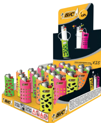
J25 BIC'IN FLUO TRAY 25 UNID. CÓD. 922230