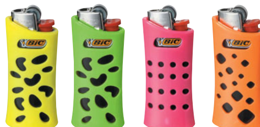
BL 3 J25 CASE FLUO FREE CÓD. 922212