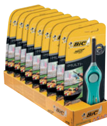
MEGALIGHTER U140 MULTI DISP 10 UNID. (CON BLISTERS) CÓD. 892542