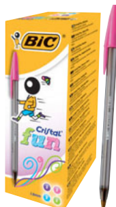
CRISTAL FUN CAJA/CAIXA 20 UNID. CÓD. 895793