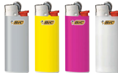
J25 MINI 50 UNID. CÓD. 8079721