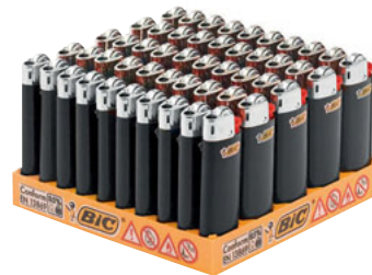
J25 MINI GOLD 50 UNID. CÓD. 830624