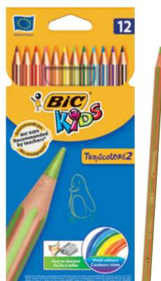
TROPICOLORS CAJA/CAIXA 12 UNID. CÓD. 832566