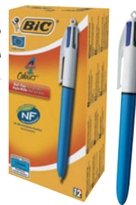
4 COLOURS CAJA/CAIXA 12 UNID. CÓD. 889969