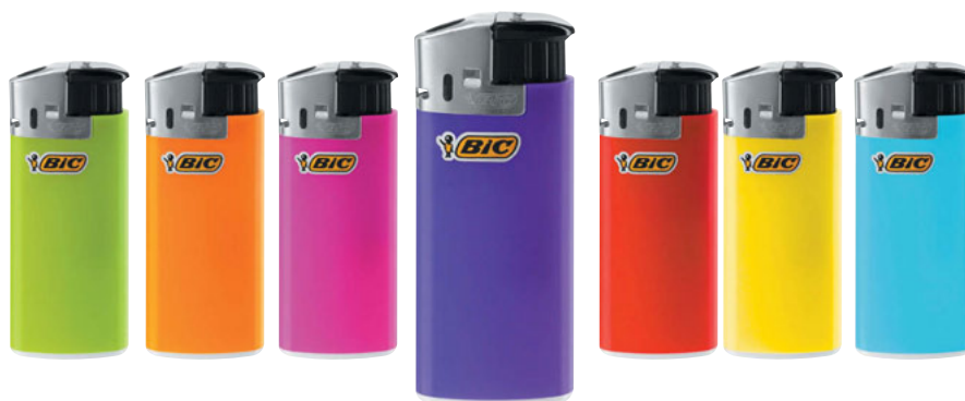
J39 MINITRONIC AST 50 UNID. CÓD. 862283