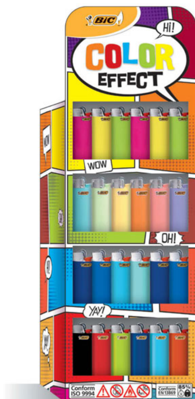
J25 COLOR EFFECT DSP 200 UNID CÓD. 946255