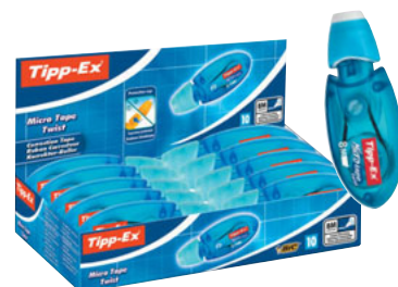
MICRO TAPE TWIST CAJA/CAIXA 10 UNID. CÓD. 8706142