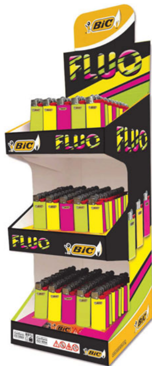
J25 FLUO DSP 150 UNID CÓD. 946251