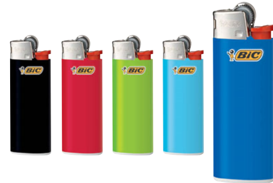
J25 MINI 3 UNID. CÓD. 807973