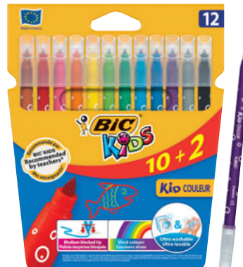
KID COLEUR 10+2 CAJA/CAIXA 12 UNID. CÓD. 9202932