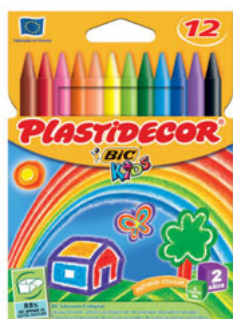
PLASTIDECOR CAJA/CAIXA 12 UNID. CÓD. 875770