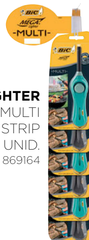
MEGALIGHTER U140 MULTI CLIPS STRIP 6 UNID. CÓD. 869164